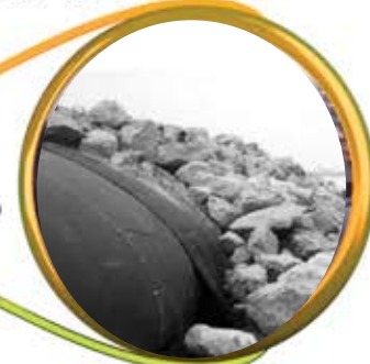
موج شکن و ساحل سازی