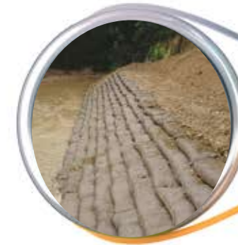
مقابله با سیل