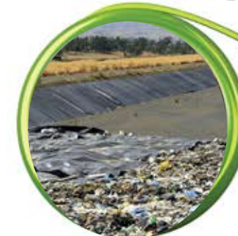
مخازن دفن زباله

استفاده از ژئوسنتتیک ها در حفاظت از محیط زیست